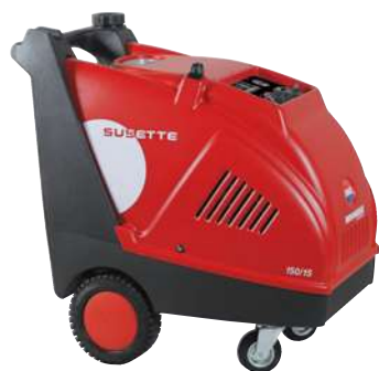
Quadro Elettrico 24 V 24 V Control Panel